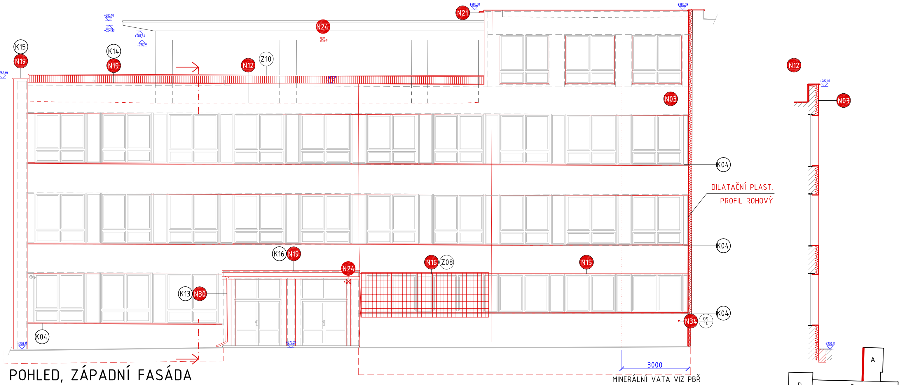
POHLED, ZÁPADNÍ FASÁDA